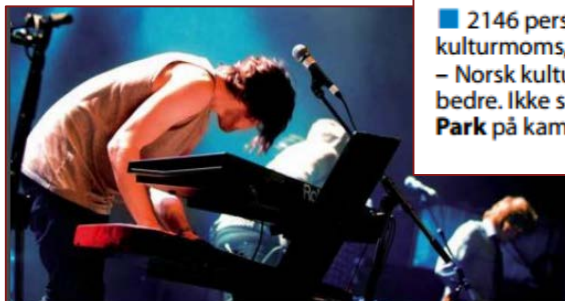
Bergensbandet Pony the Pirate spilte på Rockefeller i anledning ByLarm tidligere i år. Både byLarm og Rockefeller er blant de som står bak oppropet.