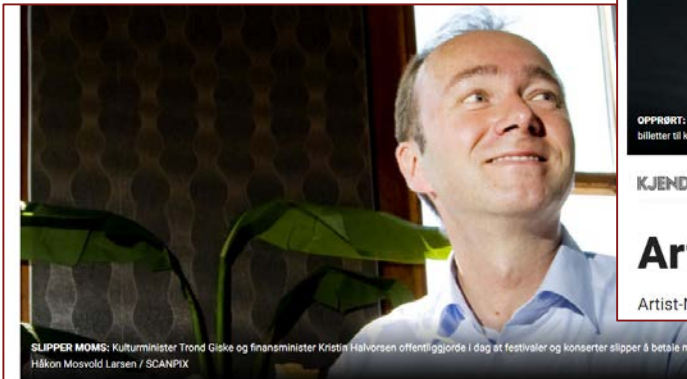
SLIPPER MOMS: Kulturminister Trond Giske og finansminister Kristin Halvorsen offentliggjorde i dag at festivaler og konserter slipper å betale mottaksavgift.